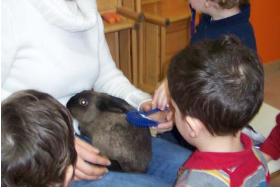
Fig. 1. I bambini mentre spazzolano “Zorro” “Zorro”