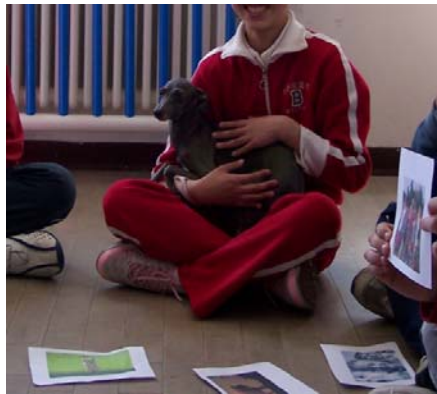
Foto 1. Una alunna accarezza Falpalà durante un circle-time

Nel gruppo sperimentale è emerso un aumento statisticamente significativo dei valori dell'autostima interpersonale. L'effetto dell'intervento assume un valore maggiore se si vanno a considerare non solo i dati quantitativi, ma anche le risposte ottenute dai questionari somministrati ai partecipanti e ai genitori degli stessi: l'intervento non solo sembra aver agevolato la conoscenza interpersonale nel gruppo classe, favorendo l'insorgere di un clima più sereno e disteso , ma sembra aver anche favorito un maggior coinvolgimento degli adolescenti nella vita scolastica.