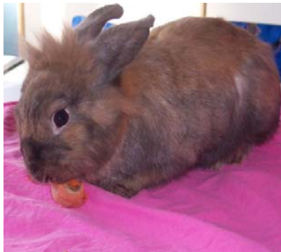
Foto 2. "Parruccone" mangia una carota offerta da un piccolo paziente