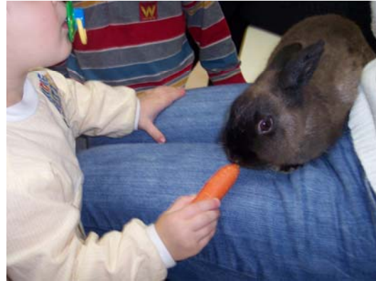
Fig. 2. I bambini danno a mangiare a